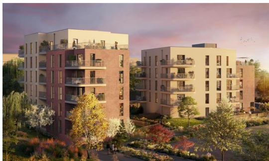
Perspective Santa Clara - Redwood (Agence JAGG)

La fin du gros-œuvre de « Santa Clara », un bâtiment de 42 logements , marque le lancement de l'aménagement de l'îlot nord. Ce bâtiment, conçu par l'agence d'architecture JAGG, sera mis à disposition d' Espacil, filiale d'Action Logement , et marque le début d'un ensemble ambitieux qui comprendra, à termes, deux immeubles de bureaux avec des locaux d'activités en rez-de-chaussée , baptisé "Network 1 et 2", un immeuble résidentiel de 47 appartements, baptisé « San Matéo » ainsi qu'une résidence urbaine de 227 logements . Redwood continue ainsi son développement en offrant une mixité d'usages pensée pour répondre aux besoins des habitants et des professionnels du territoire. L'ensemble de ces constructions contribuera activement à la dynamique de la métropole rennaise, dont l'essor se poursuivra jusqu'en 2030 .