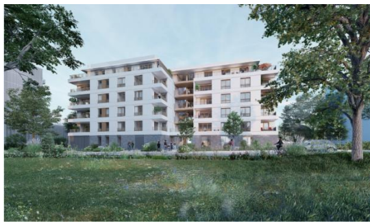
Perspective San Matéo - Redwood (Agence Leclerq Associés)